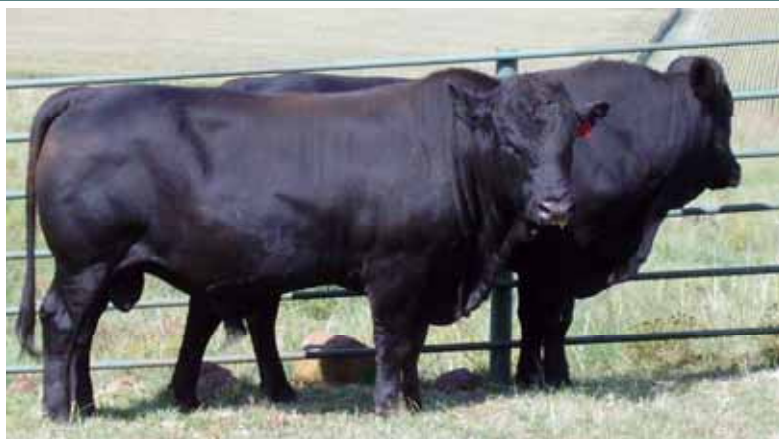
Nageslag van HN 0556 - die foto is op die Cronje's se plaas geneem.

Wat is die verskil tussen die 2009/10 en die 2010/11 toets? Al die bulle wat in 2010/11 ge-evalueer is se vaars is veldbulle. Die verskil in kondisie groei en veldvoëromset blyk duidelik uit Tabel 1.